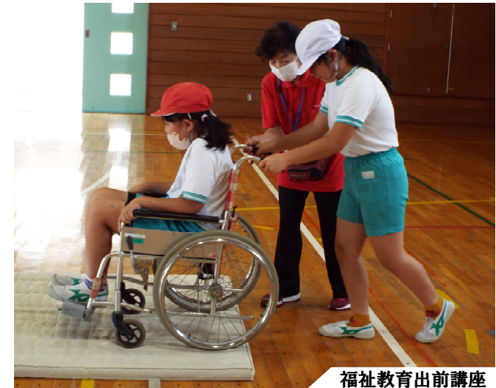
福祉教育出前講座