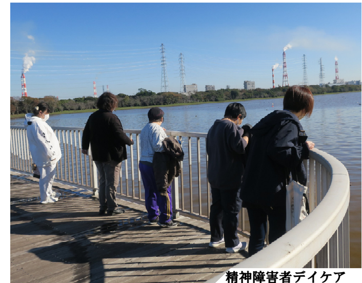
精神障害者デイケア