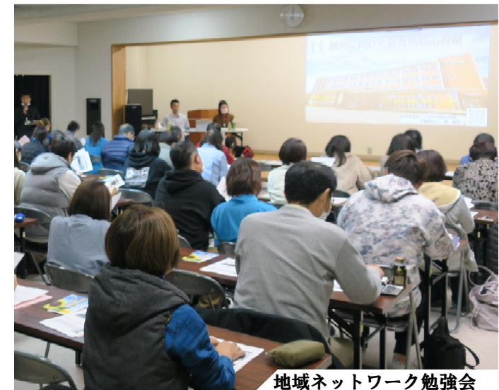
地域ネットワーク勉強会