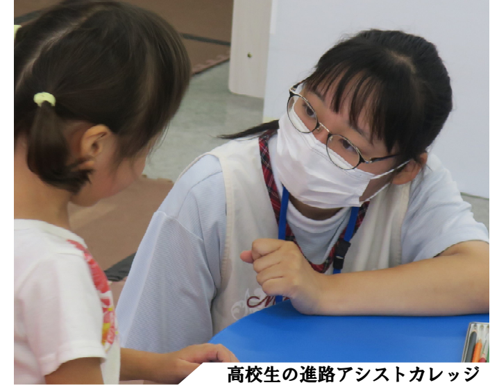
高校生の進路アシストカレッジ