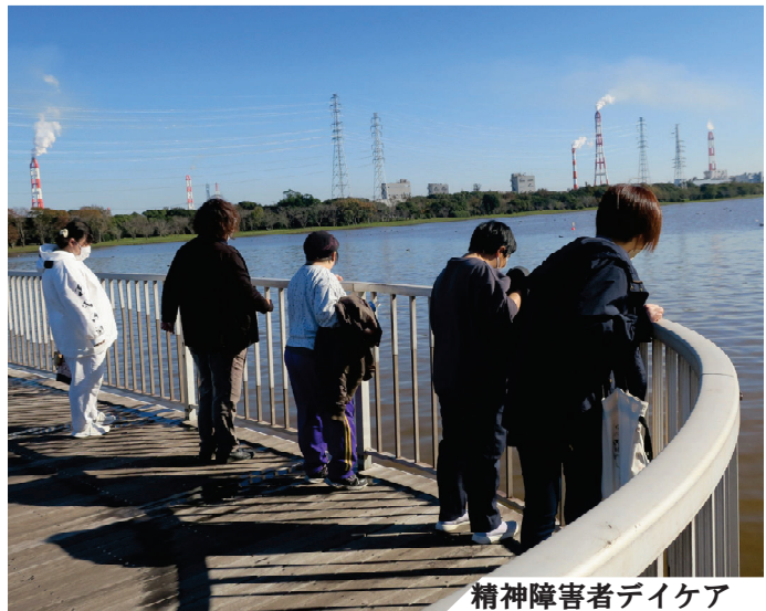
精神障害者デイケア