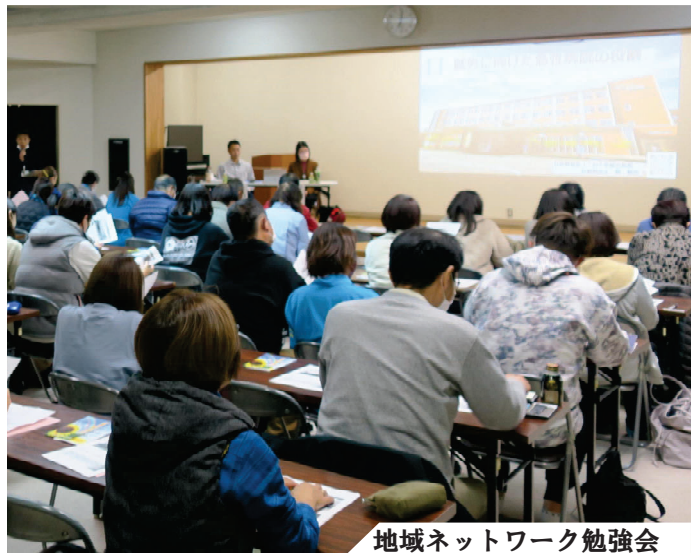
地域ネットワーク勉強会