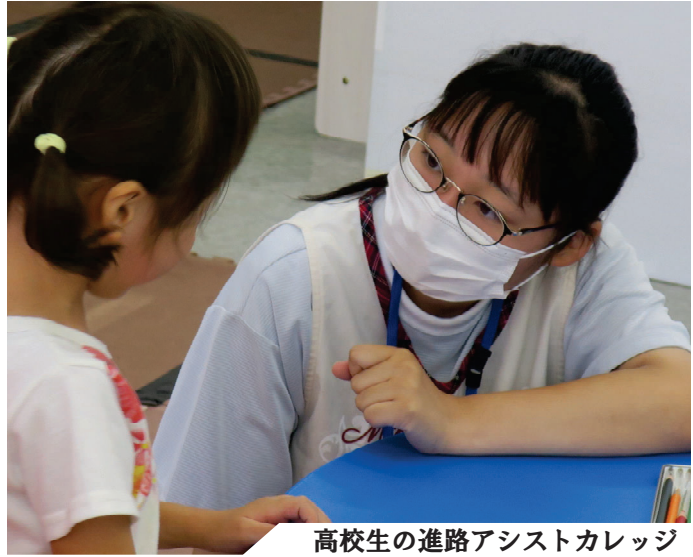
高校生の進路アシストカレッジ