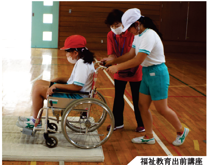
福祉教育出前講座