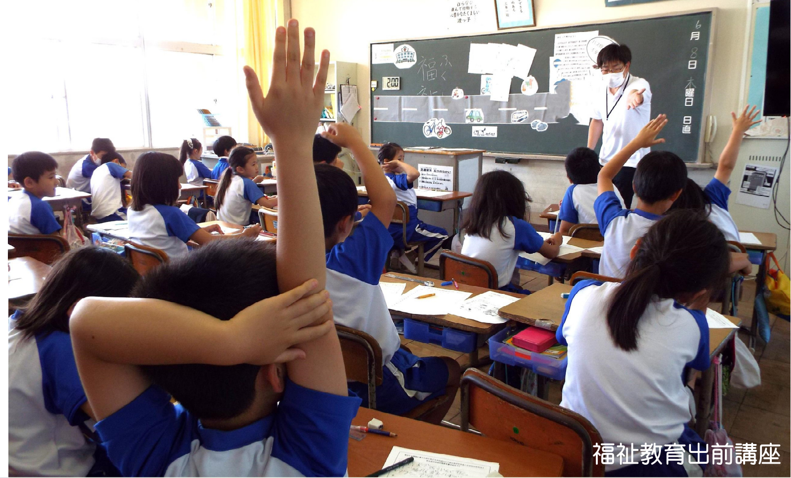
福祉教育出前講座