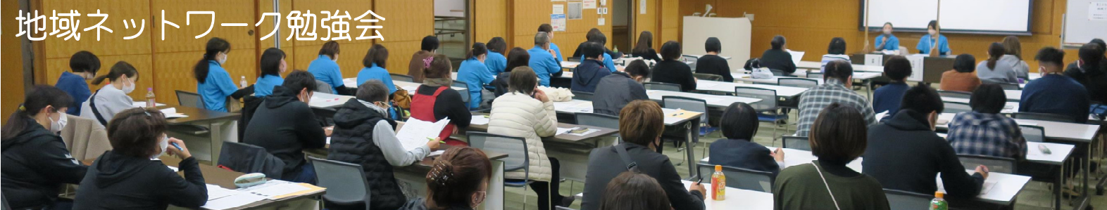
地域ネットワーク勉強会