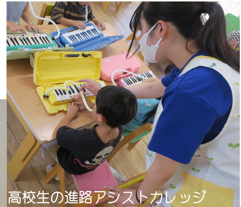
高校生の進路アシストカレッジ