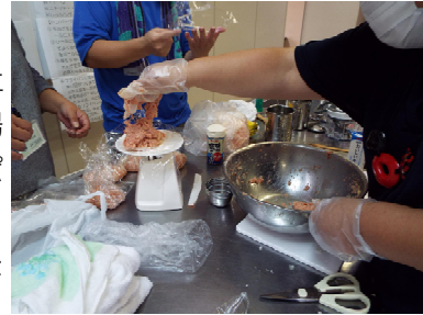
9月の調理ではハンバーグをつくり、みんなでおいしくいただきました。

参加される方が安心して過ごしていただけるように、精神保健福祉士の資格を持つスタッフがご本人の体調や意向に合わせたプログラムを提供します。