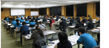
地域ネットワーク勉強会で就労支援をテーマに開催した際の様子