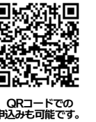
QRコードでの申込みも可能です。

日時: 7月19日(金) 時間: 午後7時～午後8時30分 場所: 保健福祉会館2階 研修室 定員: 50名(要事前申込)