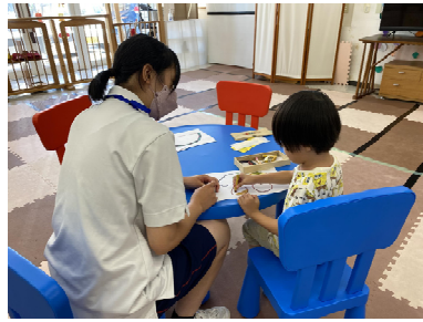
昨年度の実習の様子

高校生の進路アシストカレッジは、福祉・保育・医療関係への進学、就職を考えている仲間と共に将来の仕事について学び合える研修です。ソーシャルワーカーや介護士、保育士など、現役専門職からの講話や希望する現場での実習を通じて“専門職の魅力・やりがい”を感じることができます。